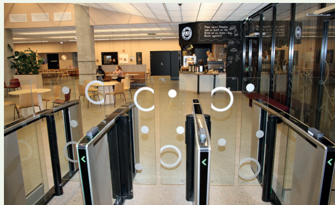
På vei inn i skolebygget er det også en inngang mot kafeen.